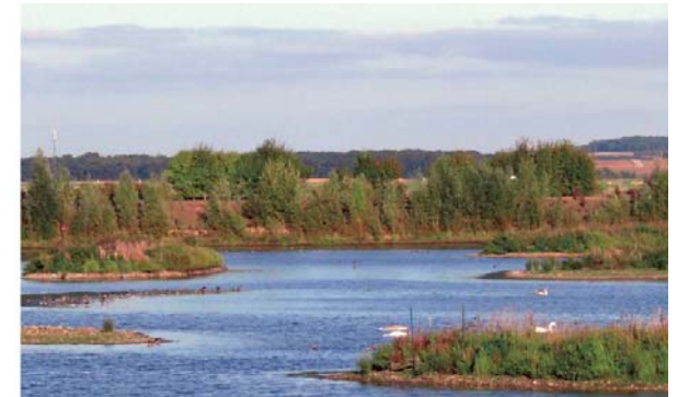
Réserve ornithologique sur une ancienne carrière de la vallée de la Seine (77)